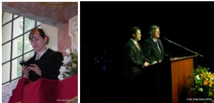
Tiszteletes Szappanos Kitti legátus az öcsödi szószéken Pünkösdhétfőn, illetve Franklin Graham a Reménység Fesztiválon Budapesten.

• 09-én Debrecenben leadtuk a régi, és átvettük az új szolgálati autót.