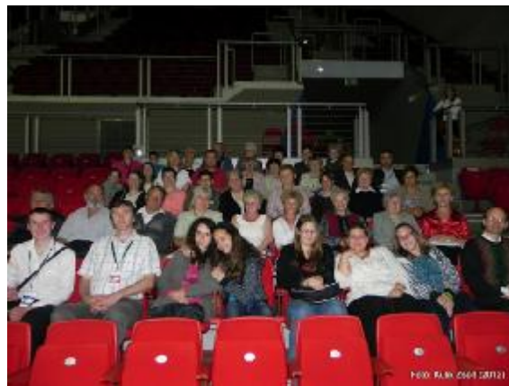
Csoportkép rólunk a Reménység Fesztiválon Még több kép: http://ocsodref.fw.hu