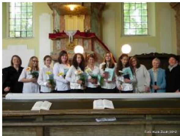
Konfirmáció – Öcsöd, 2012.